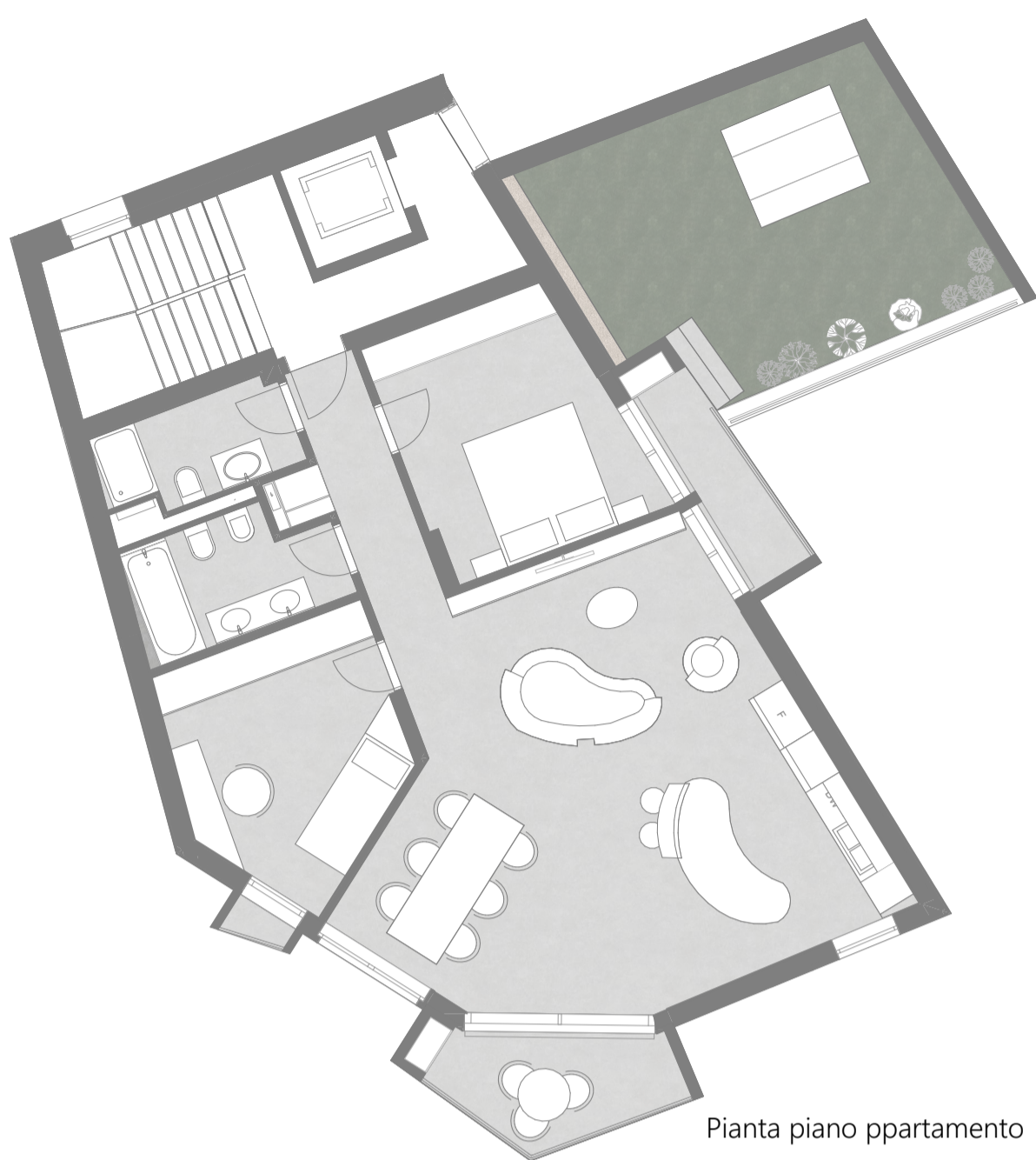
Pianta piano appartamento