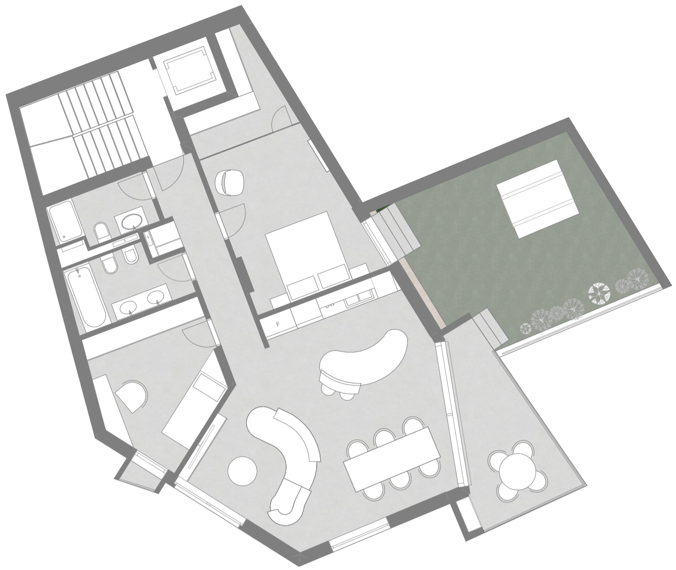
Pianta piano appartamento